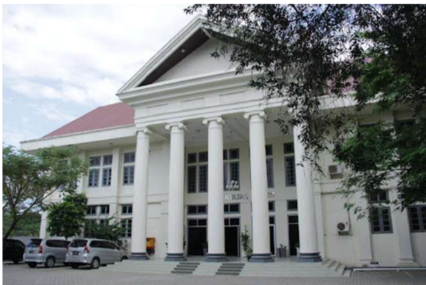
Gambar 1.1 Gedung Fakultas Hukum Universitas Syiah Kuala

Fakultas Hukum Universitas Syiah Kuala (USK) merupakan perguruan tinggi negeri tertua di Aceh. Berdiri pada tanggal 2 September 1961 dengan Surat Keputusan Menteri PTIP Nomor 11 Tahun 1961, tertanggal 21 Juni 1961. Fakultas Hukum terakreditasi dengan peringkat akreditasi A, dan hingga saat ini masih memperoleh akreditasi dengan peringkat A berdasarkan Keputusan Badan Akreditasi Nasional Perguruan Tinggi Nomor 3423/SK/BAN-PT/Ak-PPj/S/VI/2020 tanggal 9 Juni 2020. Fakultas Hukum memiliki fungsi yang sangat strategis dalam meningkatkan kualitas sumber daya manusia, baik untuk kebutuhan lokal, regional, nasional maupun global. Fakultas Hukum berkomitmen untuk mengutamakan mutu, mengintegrasikan nilai-nilai universal, nasional, dan lokal untuk melahirkan sumber daya manusia yang memiliki keselarasan antara IPTEK dan IMTAQ. Keseimbangan diantara keduanya menjadi komponen utama dalam menghasilkan sumber daya manusia yang berkualitas, berbudi pekerti, menjunjung tinggi etika, estetika serta berakhlak mulia.