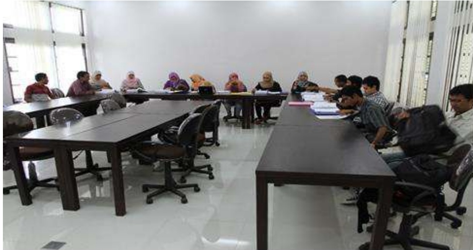
Gambar 1.8 Ruang belajar program kelas internasional