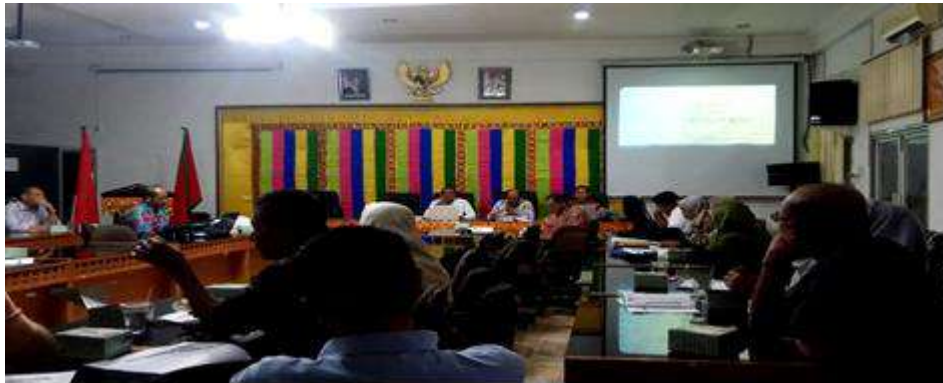
Gambar 1.3 Aula tempat dilaksanakannya workshop , kuliah tamu maupun kegiatan akademik lainnya