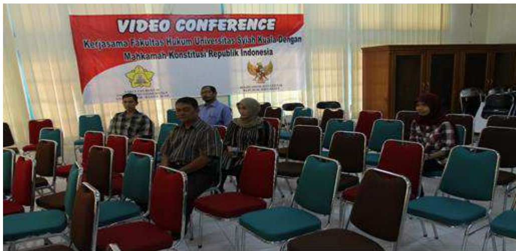
Gambar 1.4 Ruang video conference Mahkamah Konstitusi

Ruang video conference dimanfaatkan untuk penyelenggaraan sistem informasi manajemen perkara, penyelenggaraan persidangan mahkamah konstitusi jarak jauh, penyiaran persidangan mahkamah konstitusi secara langsung, penyelenggaraan pusat informasi hukum online, penyelenggaraan lomba debat konstitusi, sosialisasi hukum acara mahkamah konstitusi, penyelenggaraan peradilan semu ( mootcourt ), dan kuliah jarak jauh.