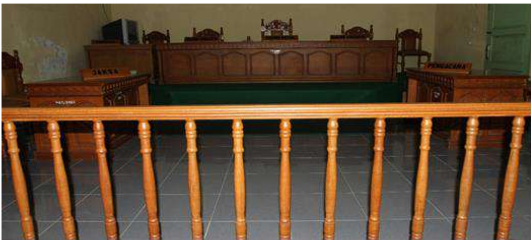
Gambar 1.6 Laboratorium klinis hukum sebagai sarana pendukung bagi mata kuliah pendidikan dan latihan kemahiran hukum