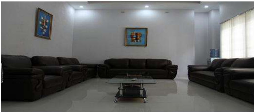
Gambar 1.7 Ruang istirahat staff pengajar yang dilengkapi dengan pantry