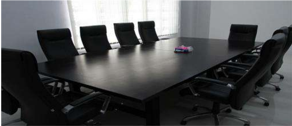
Gambar 1.5 Ruang rapat untuk rapat terbatas pimpinan