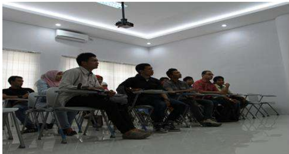
Gambar 1.9 Ruang belajar program reguler